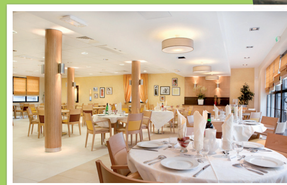
«La Chartreuse» Résidence Médicalisée EHPAD Commune de Coutras / Gironde